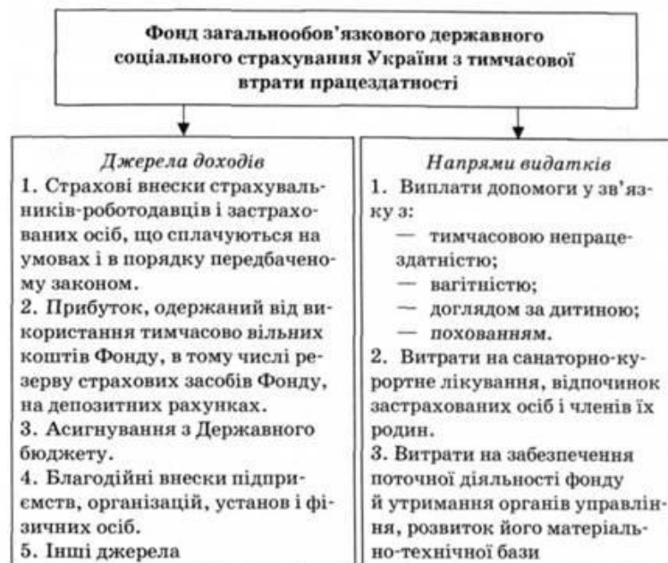
Рис.2 Діяльність Фонду загальнообов'язкового державного соціального страхування України з тимчасової втрати працездатності.

При плануванні страхових внесків страхувальників та застрахованих осіб враховуються зміни у законодавстві щодо сплати і розподілу єдиного внеску.