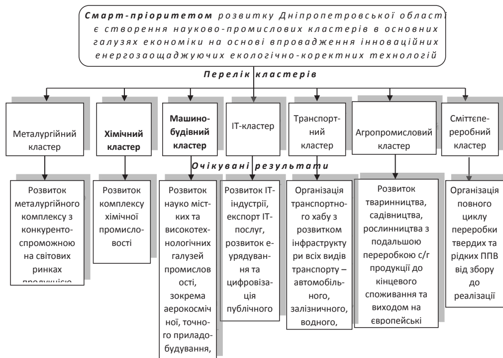
Рис. 3. Перспективи розвитку смарт-спеціалізації Дніпропетровської області (за оптимістичним сценарієм)

Так, згідно з оптимістичним сценарієм включені ще кілька цілей та відповідних програм реалізації Стратегії, до оперативних цілей та проектів, реалізація яких дозволить сформува- смарт-спеціалізації поступово можуть бути ти на території області сім кластерів (рис. 3).