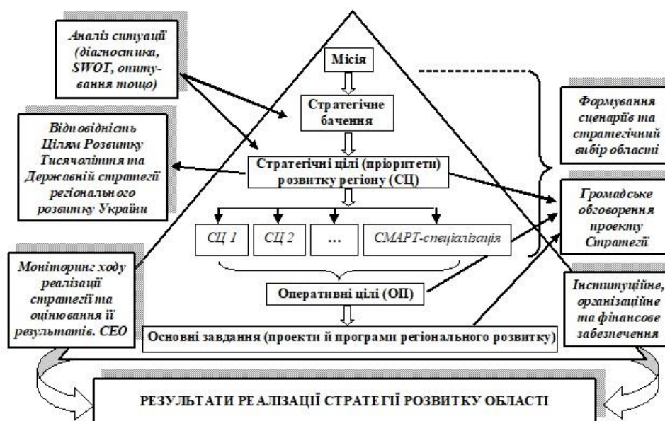
Рис. 1. Узагальнена модель процесу формування Стратегії розвитку Дніпропетровської області на період до 2027 року

Узагальнену модель процесу формування Стратегії розвитку Дніпропетровської області на період до 2027 року представлено на рис. 1.