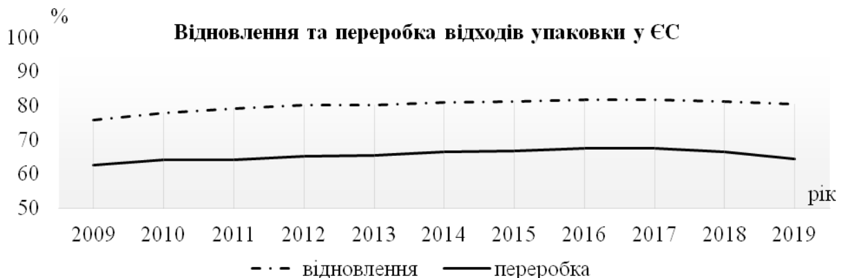
Рис. 2. Відновлення та переробка відходів упаковки у ЄС, 2009 – 2019 рр. [2]

Директива встановлювала цілі із досягнення від 55 до 80 % переробки відходів упаковки. На діаграмі рис. 2 видно, що рівень переробки відходів упаковки в середньому становить понад 64 %, і досягнуто рівня утилізації із рекуперацією понад 80 %.