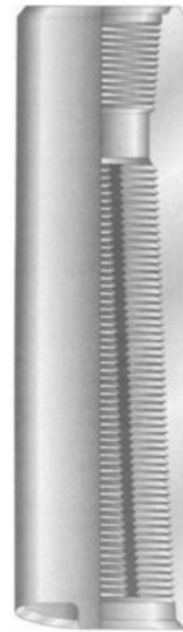
Рис. 3. – Ловильний колокол

Якщо кабель спресувався у клубок, в який неможливо впровадити ні гачок, ні вилку, то можна спробувати навернути на цей клубок ловильний колокол (рис. 3). Проміжок між колоколом і стінками свердловини повинен бути мінімальним. Також мінімальною має бути товщина стінки колокола у його нижнього торця. Захоплений колоколом кабель витягують у лінію, переміщуючи вверх положення «голови» кабелю.