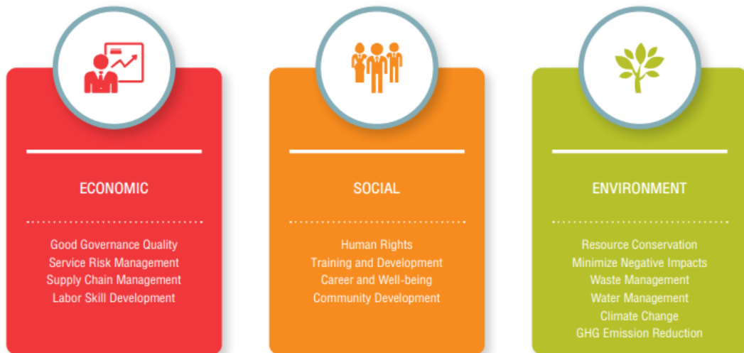
Рисунок 2 – Політика та структура сталого розвитку Centara Hotels & Resorts [4]

Для Centara Hotels & Resorts (провідна мережа готелів у Таїланді) ведення сталого бізнесу – завдання, яке вимагає співпраці з усіма сторонами, включаючи керівників і співробітників. Вона ставить за мету впровадження екологічних методів у діяльності, забезпечуючи винятковий рівень гостинності для клієнтів (рис. 2).