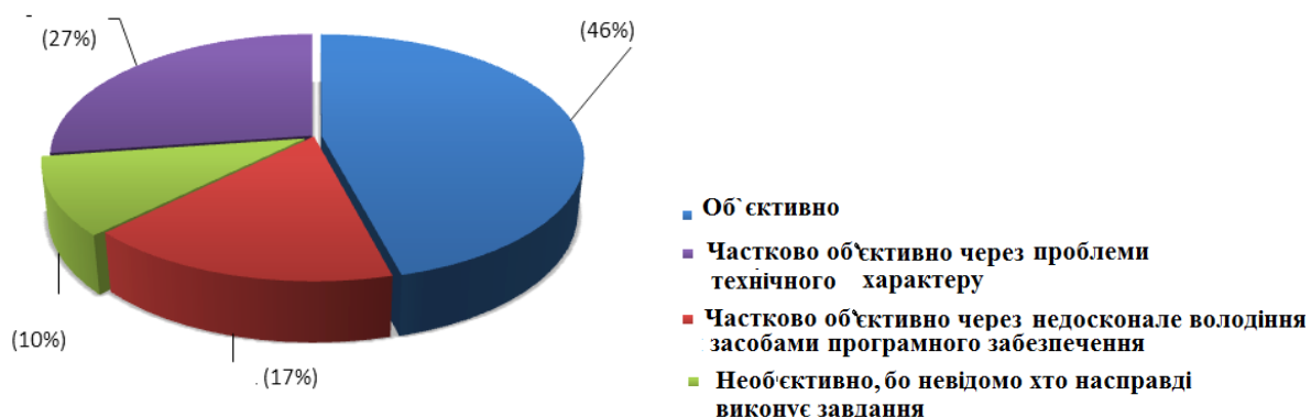
Рис. 2. – Об'єктивність оцінювання під час дистанційного навчання (з точки зору опитаних студентів)

Однак усі опитані відзначають, що при поверненні до нормального мирного життя, вони б надали перевагу змішаному формату навчання («наживо»+дистанційно).