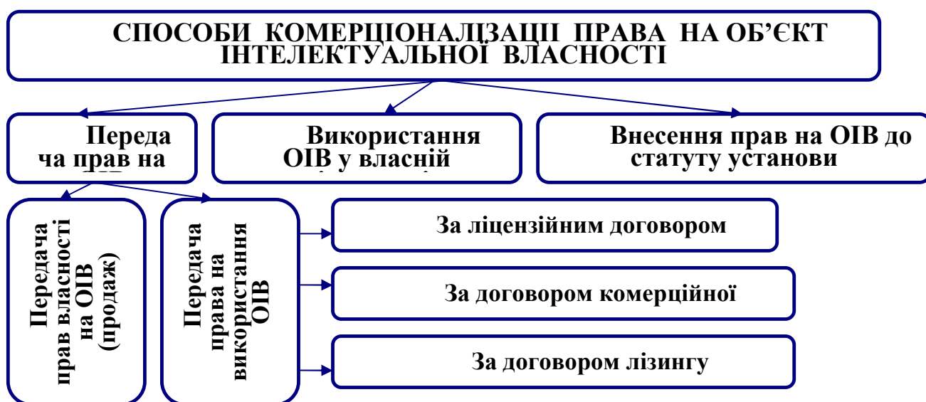
Рис. 2. Способи комерціалізації права на об'єкт інтелектуальної власності (далі – ОІВ) у галузі знань “Публічне управління та адміністрування” і в галузі науки “Державне управління”

Стратегією сталого розвитку “Україна-2020” також визначено, що Україна повинна стати державою із сильною економікою, з передовими інноваціями (вектор розвитку). Тому метою державної політики в інтелектуальній сфері має стати формування й запровадження сучасної моделі інтеграції інтелектуального потенціалу нації у внутрішній та світовий ринки, враховуючи як національну специфіку процесів перетворення інтелектуального надбання в конкурентоспроможну продукцію, так і відповідний світовий досвід, при цьому варто враховувати, що одним із чинників, що забезпечують сталий економічний розвиток є комерціалізація права на об'єкт інтелектуальної власності (рис.2):