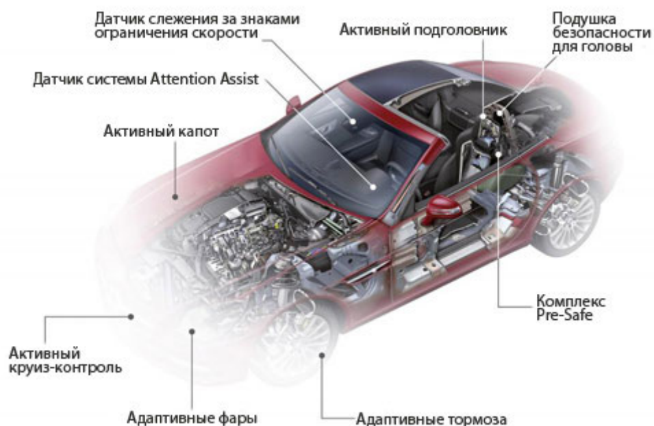
Рис. 3.1. Деякі елементи безпеки автомобіля

Внутрішню пасивну безпеку забезпечують елементи, що передбачають зниження інерційних перевантажень у процесі удару, обмеження переміщення людей у салоні, відсутність травмонебезпечних деталей, закріплення багажу й інструмента. До неї відносять форму кузова, наявність бамперів, ремнів безпеки, пневматичних подушок, підголовники, травмонебезпечні рульові колонки, скло, і всі елементи салону.