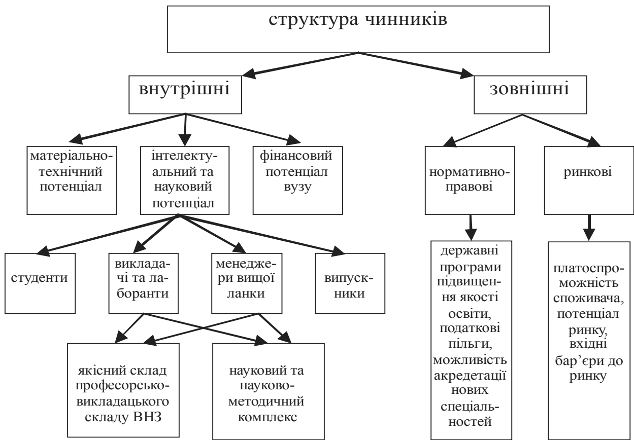
Рис. 2. Цільова класифікація чинників конкурентоспроможності випускника відносно до конкурентоспроможності ВНЗ