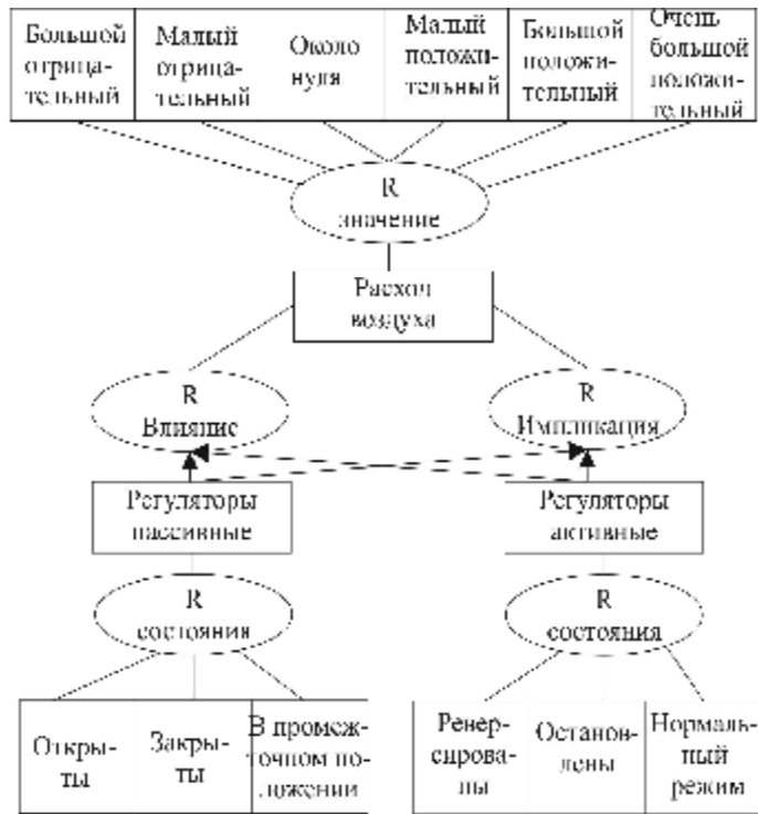
Рис. 1. Семантическая структура информации о возможностях изменения вентиляционных режимов

Формальная запись базы знаний о возможностях по изменению вентиляционных режимов в виде системы логических (импликативных) уравнений